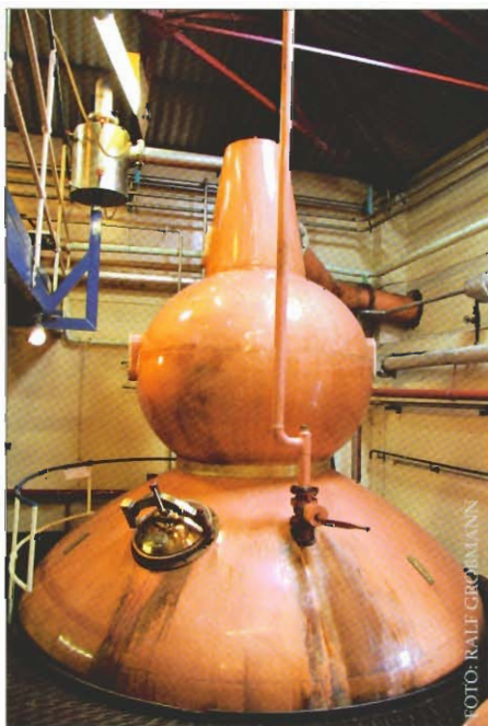
Die »abgesägte« wash still

Wäre Wick besuchenswert, gäbe es dort nicht die Pulteney Distillery?